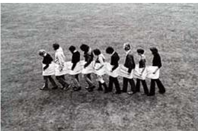
Franz Erhard Walther, Kurz vor der Dämmerung , 1967