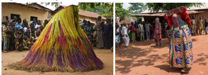
Figure du Zangbeto, Bénin