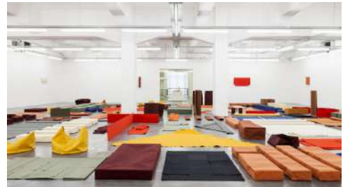
Vue de l'exposition The Body Decides , 2014 au WIELS, Bruxelles

L'œuvre de cet artiste allemand se situe à la croisée de la sculpture minimaliste, l'art conceptuel, la peinture abstraite et la performance. Walther transforme la notion d'objet et de perception, et ce, à travers le dessin, la peinture, la sculpture de tissus, des formes participatives, et des œuvres s'appuyant sur le langage, la documentation photographique et le matériau d'archives.