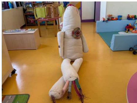
Installation en format muséal, accueillie à la crèche Nougatine de Guipry-Messac en juin 2024 (à gauche) et au SAJ de La Courmeuve (à droite) en février 2025 lors de résidences.