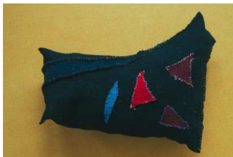
Fabrication de doudou en laine bouillie et fil de lin