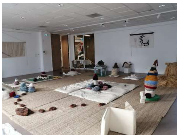
Installation en format tapis, à gauche accueillie en boîte noire lors d'une résidence en théâtre (Le Strapontin/sept 2025), à droite accueillie en lumière naturelle lors d'une résidence dans une salle polyvalente de MJC (MJC de Pacé/déc 2024)