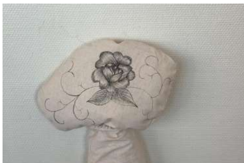
Dessin au trait sur toile de métis