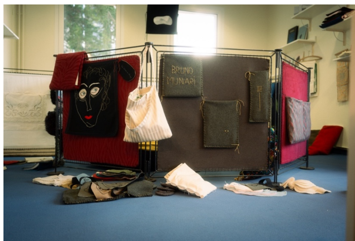
Zabécédaire présenté à la médiathèque Keryado de Lorient, février 2026