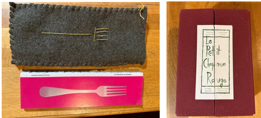
Exemples de livres d'artistes faisant partie du fonds Zabécédairer A gauche : Le furchete de Bruno Munari A droite : Le petit chaperon rouge de Warja Laater adapté par Myriam Colin