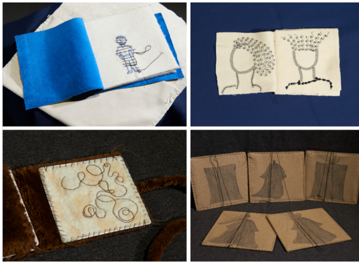
Exemples de Chunos , livres textiles de Christelle Hunot